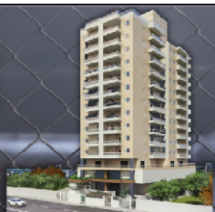
TABELA DE VENDAS